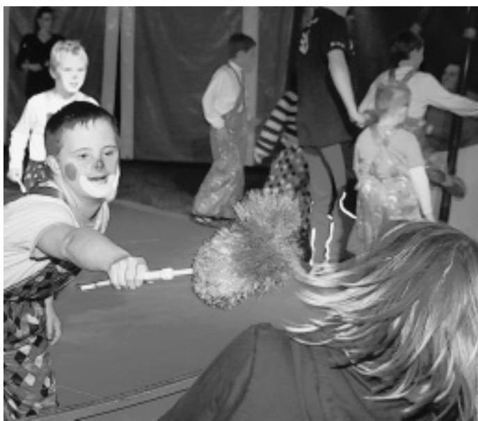
Elektrisiert: Als Clowns verkleidet wedeln die Kinder den Zuschauern über die Haare.