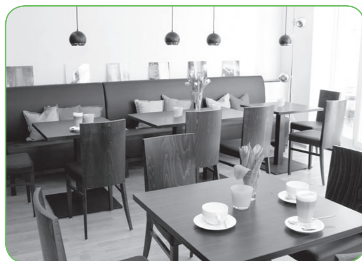
Das neue KIZ Café Klee in der Mindener Innenstadt